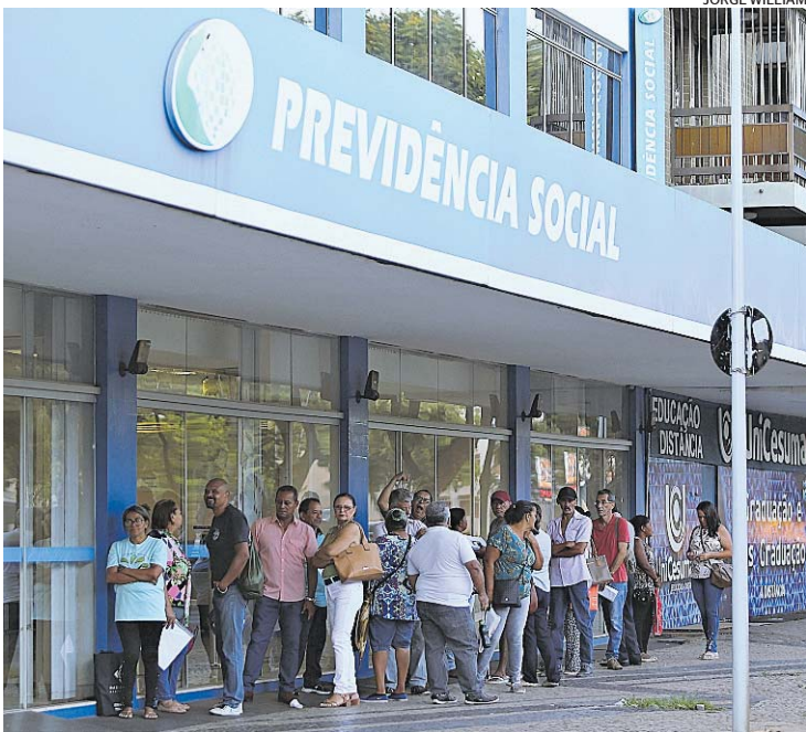
Mutirão terá ações nos fins de semana para agilizar benefícios

O objetivo é reduzir o tempo de espera da concessão de benefícios para no máximo de 45 dias. Em abril, o prazo médio de demora na análise do pedido estava em 74 dias, enquanto no mesmo mês do ano passado eram 93. x