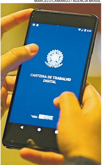
Carteira assinada: recuo

— Isso não significa que o valor é suficiente para a pessoa não trabalhar. Mas, para muita gente, não faz sentido procurar emprego nessas condições, principalmente em regiões que têm alta informalidade e salário muito baixo — afirmou Tobler. x